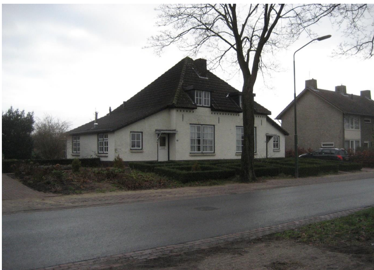
Pastoor P. Thijssenlaan 32-34