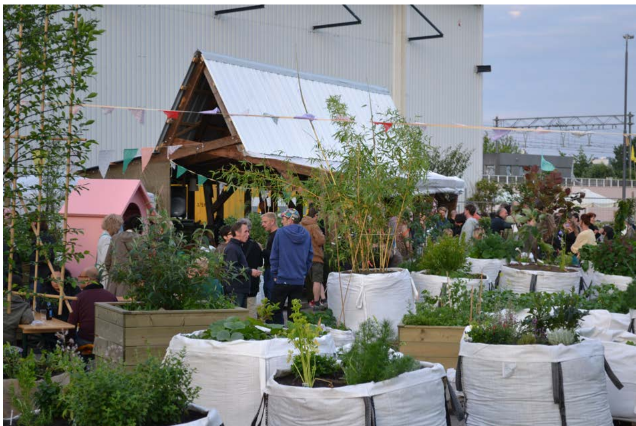
Stadslandbouwproject Gardenmania in Eindhoven

Klik hier om naar de regeling/het aanvraagformulier te gaan.